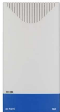
Mitel 100 im Wandgehäuse